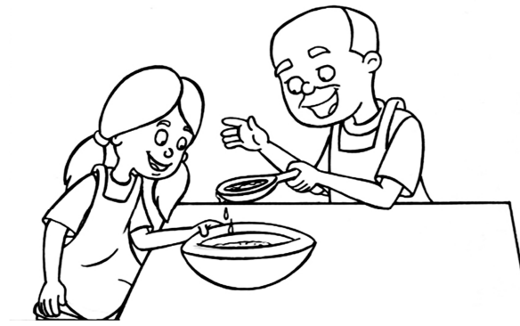
Mình bỏ vào ít bơ.