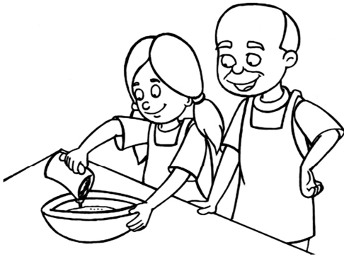
Mình bỏ vào ít sữa.